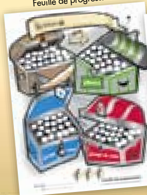
Feuille de progression